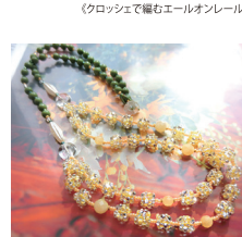
Miho 《グラニデ (mimosal)》