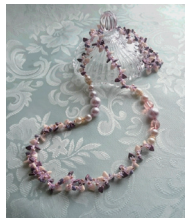
小坂あや子 《ビーズクロッシェのネックレス〜スイート〜》