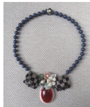
日名子 八重子 《〜chimitsu 2017〜》