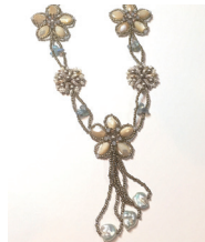
本間久美子 《スノーフラワー》